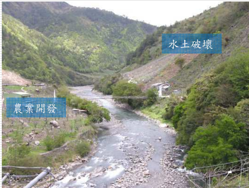
櫻花鉤吻鮭的故鄉-七家灣溪的棲地劣化與破壞