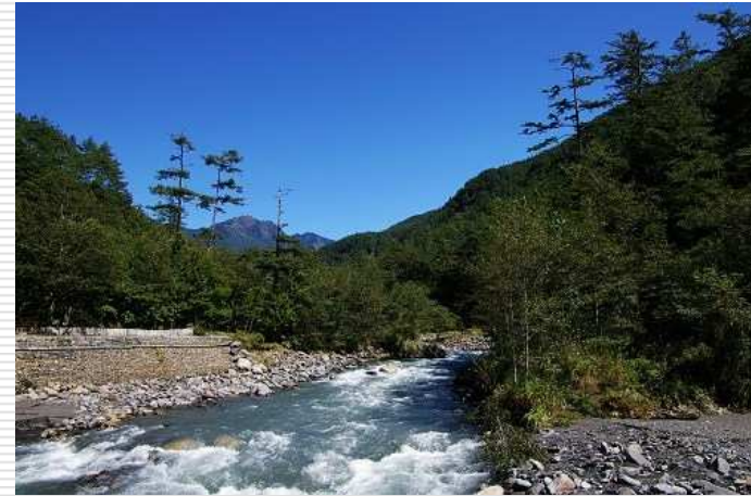
禁止沿溪開發利用、保護濱溪地帶（維護溪流生態功能與食物網系統的完整）